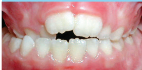
Mordida Cruzada Posterior

Los dientes posteriores de la arcada superior se encuentran por adentro de los inferiores