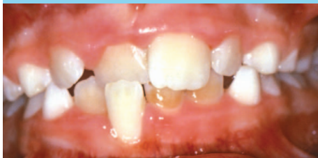
Mordida Cruzada Anterior

Dientes de arriba se encuentran por detrás de los de abajo