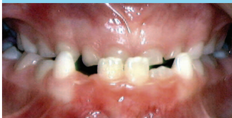
Mordida Anterior Cruzada

Los dientes de la arcada inferior están por delante de los superiores cuando los dientes posteriores están en contacto