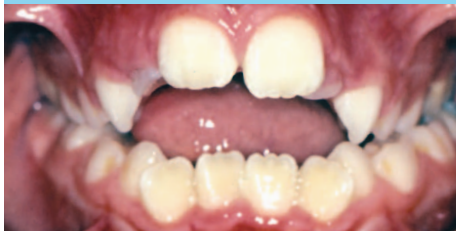
Mordida Abierta Anterior

Los dientes de adelante no tocan cuando los dientes de atrás están tocando